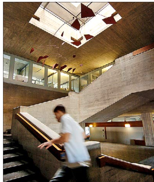
Weit oben in MBA-Ranglisten: die Universität St. Gallen (rechts) und die Simon School der Universitäten Rochester und Bern.